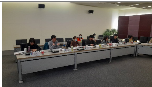
屏東高中洪主任提供寶貴意見