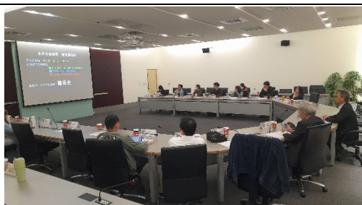
黃教務長致詞歡迎與會來賓