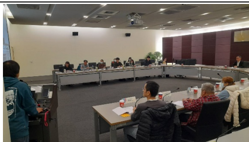
藝史系黃主任進行簡報