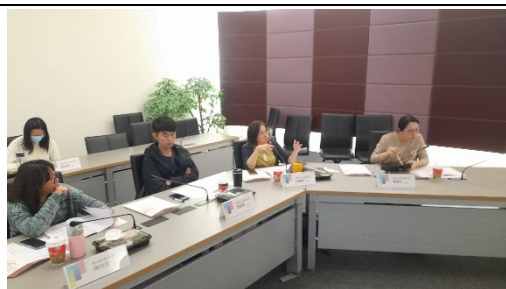
鼓山中學許主任提供寶貴意見