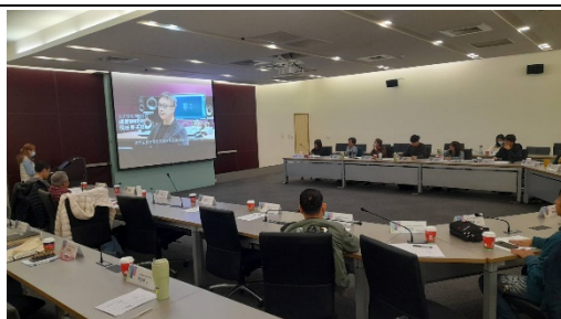
應音系吳老師專業簡報介紹系所