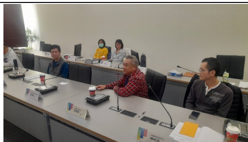
材創系張老師與高中端師長交流