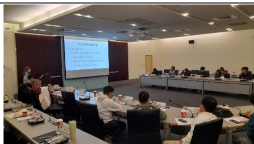
高中端師長專心聆聽各系介紹